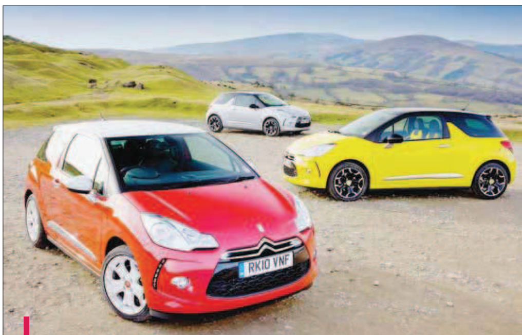
Dans la famille Citroën, l'histoire de la très séduisante DS3 ne fait que commencer.

Après le succès extrêmement relatif du Renault Modus, on croyait que les minispaces n'avaient pas le vent en poupe. Malgré tout, Opel a renouvelé